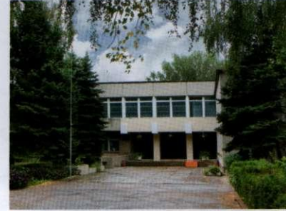
18029, м. Черкаси, вул. Смілянська, 132 Телефон: (0472) 63-47-28, 63-45-71 e-mail: chocentmanum@mail.ru

Відлік юннатівського руху ведеться з 1925 року, а його історія на Черкащині починається з дня утворення в січні 1954 року Черкаської області та відкриття в лютому цього ж року обласної станції юних натуралістів.